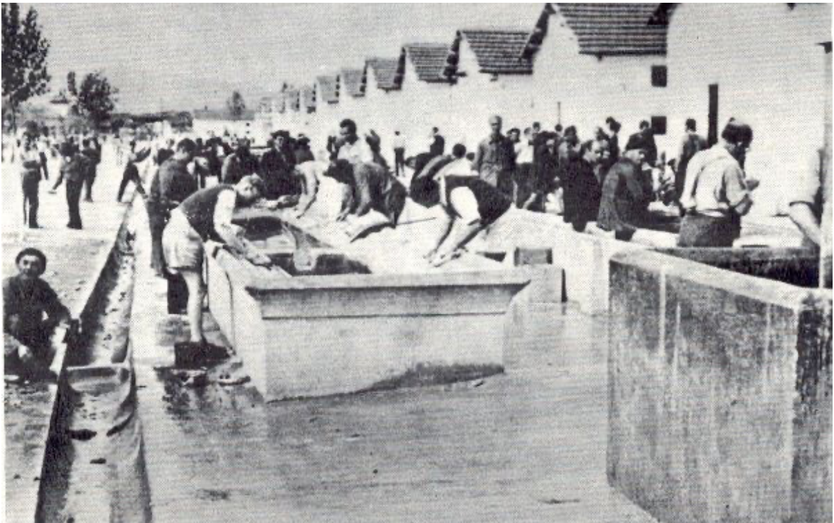
Jour de lessive au camp de Miranda

Le 17 Juin je débarque à Casablanca, six mois après avoir quitté la France.