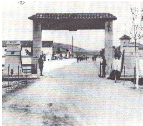
La porte d'entrée du camp

Vers deux heures du matin nous traversons une seconde porte et nous nous trouvons alors dans le camp proprement dit. Nous touchons chacun deux couvertures, une toile de paille, une assiette métallique, une cuillère. Un hangar vide et sale nous est assigné comme logement. Malgré l'heure avancée, la cuisine du camp nous sert une soupe de pommes de terre chaude que nous apprécions, n'ayant pas diné. Puis nous gagnons notre hangar et nous nous endormons pour notre première nuit.