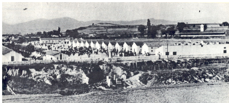
Vue générale du camp

Nous sommes maintenant prisonniers de façon plus tangible qu'à Lecumberri. Il n'y a plus cette fiction apparente de la vie d'hôtel. Non, c'est le camp de concentration. Un camp où des hommes sont enfermés depuis plus de quatre ans. Ne sortirons-nous jamais d'Espagne ? Tous les espoirs que nous avons conçus à Lecumberri s'évanouissent.