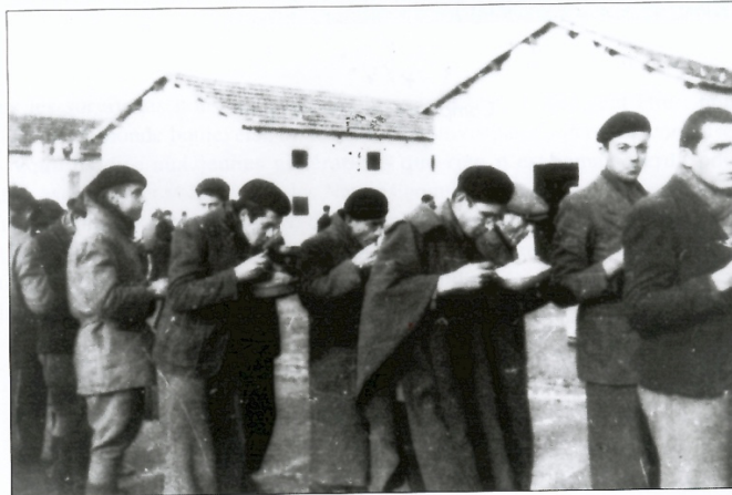
Camp de Miranda de Ebro. La soupe est prise debout.

Nous recevons de nombreux colis de la Croix Rouge Américaine composés d'excellentes conserves. En utilisant ces différentes ressources nous arrivons à manger à peu près correctement, je veux dire une nourriture à peu près correcte. J'ai même plusieurs fois l'occasion de faire de la pâtisserie dans un four que j'ai fabriqué avec deux boîtes à biscuit.