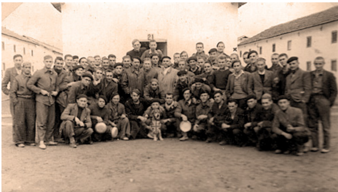
Photo de groupe des prisonniers

Toujours est-il que, vers le 25 mai, mon nom figure sur une liste de libérés ... à la suite de l'heureuse influence de quelque menu bakchiche. Les fonctionnaires espagnols sont très compréhensifs. Je fais ensuite partie d'un groupe de libérés sortis directement par le Consul des Etats Unis le 7 juin.